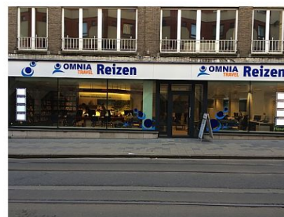
Omnia Travel – Reiskantoor GENT

Tel Vakantiereizen: 02 645 56 12 Fax: 02 645 56 01 brussels@omniatravel.be Openingsuren: ma – vr: 09u00 – 17u00