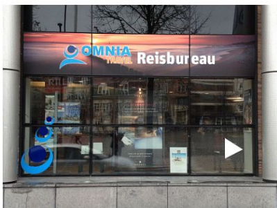
Omnia Travel – Reiskantoor LEUVEN

Tel: 011 28 51 30 Fax: 011 28 51 07 hasselt@omniatravel.be Openingsuren: ma – vr: 09u00 – 17u30 do: 09u00 – 18u00