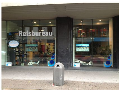
Omnia Travel – Reiskantoor ANTWERPEN

Vous pouvez aussi contacter nos collaborateurs expérimentés par mail ou téléphone.