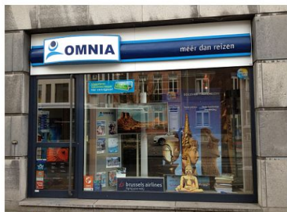
Omnia Travel – Reiskantoor HASSELT