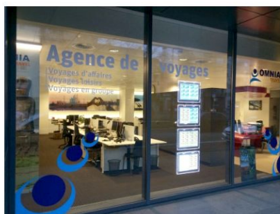
Omnia Travel – Reiskantoor BRUSSEL

Tel Vakantiereizen: 03 202 93 87 Fax: 03 202 91 54 antwerpen@omniatravel.be Openingsuren: ma – vr: 09u00 – 17u30 za: 09u45 – 12u30 (niet in jul. & aug.)