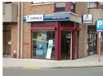
Omnia Travel – Reiskantoor ROESELARE

Tel Vakantiereizen : 016 24 38 10 Fax: 016 24 38 01 vakantiereizen@omniatravel.be Openingsuren: ma – vr: 09u00 – 17u00 za: 9u45 – 12u30 (niet in jul. & aug.)